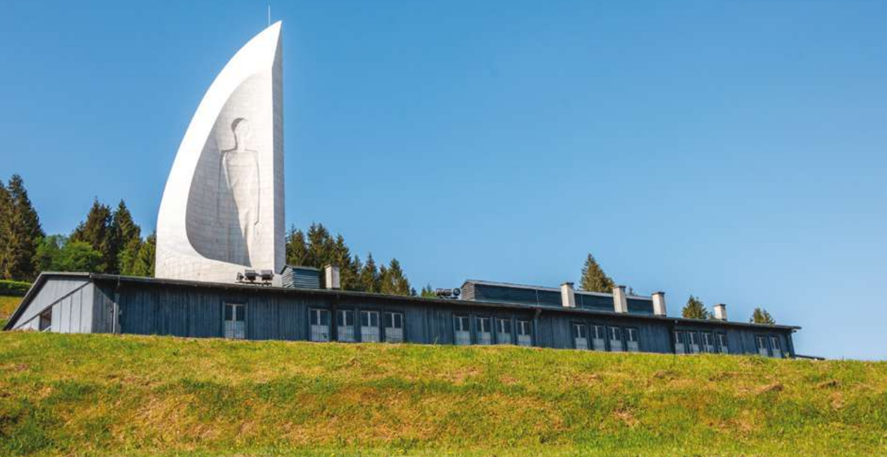
Vue du Monument depuis l'intérieur du camp. / Blick auf das Mahnmal vom Lagerinneren aus. / View of the Monument from inside the Camp.