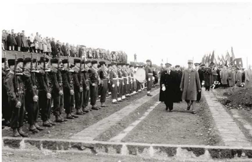
Cérémonie d'inhumation dans la Nécropole nationale du Struthof, 5 juillet 1957. / Beisetzungszeremonie in der nationalen Nekropole am Struthof, 5. Juli 1957. / Burial ceremony at the national necropolis at Struthof, 5 July 1957.