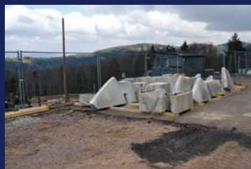
Dépose des parements en pierre de Hauteville. / Aus der Außenhülle entfernte weiße Steinblöcke aus Hauteville. / The Hauteville stone facing slabs are removed.