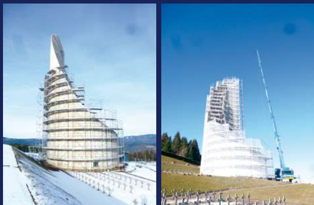
Les travaux de restauration du monument. / Restaurierungsarbeiten am Mahnmahl. / Restoration work on the monument.