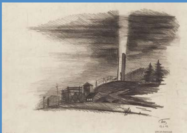
Avant-projet de mémorial, vue d'ensemble depuis l'entrée du camp, 1953. Vorentwurf Mahnmahl, Gesamtansicht vom Lagereingang aus, 1953. Draft plan for the memorial, overall view from the camp entrance, 1953.