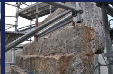
Dégagement de la structure primaire en béton. / Freilegen der Gebäudestruktur aus Beton. / The concrete core of the structure is revealed.