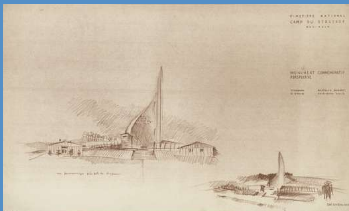
Esquisses de la « Flamme-Mémorial », 2 octobre 1953. Skizze des flammenförmigen Mahnmals, 2. Oktober 1953. Sketches for the «Memorial Flame», 2 October 1953.

Fonds Denkmalarchiv, Ministère de la culture, DRAC Grand Est, CRMH Frz. Kulturministerium, Kulturbehörde (DRAC) und Amt für Denkmalpflege (CRMH) der Region Grand Est Ministry of Culture, Eastern France Regional Directorate of Cultural Affairs, Regional Historic Buildings Service © Monuments historiques